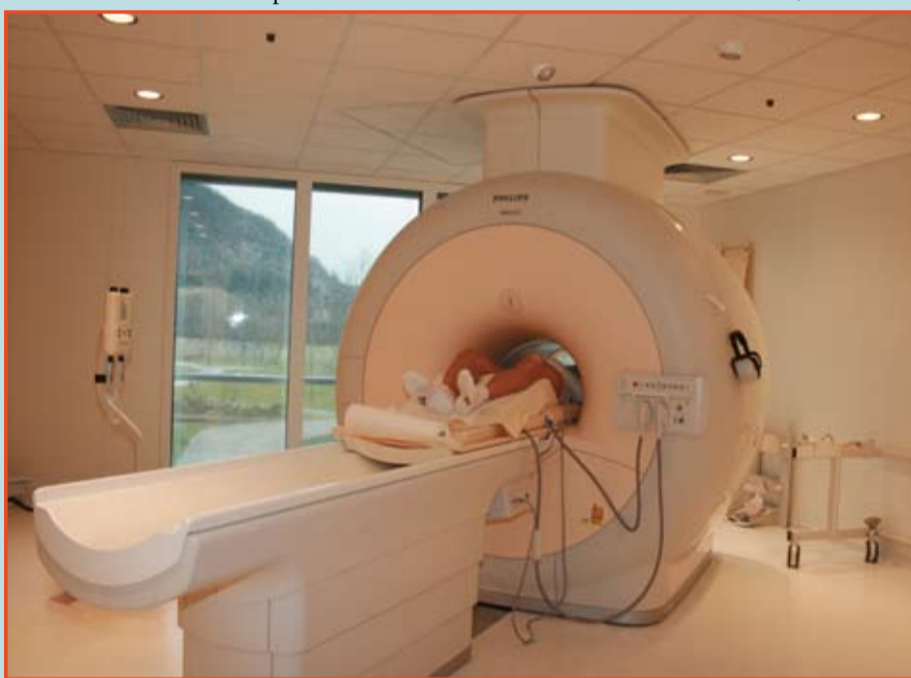
Für alle Notfallpatienten bedeutet die rasche und exakte Diagnose im neuen MRT einen wertvollen Vorteil.

Sollten Sie von Ihrem behandelnden Arzt eine Überweisung zu einer MRT-Untersuchung erhalten haben, so können Sie auch selbst telefonisch einen Termin vereinbaren. Die Rufnummer lautet: 05372/6966-4949. Das Telefon ist von Montag bis Freitag zwischen 8:00 und 17:00 Uhr mit einer Radiologietechnologin aus dem MRT-Team besetzt. Unsere Mitarbeiter können Fragen zur Untersuchung kompetent beantworten.