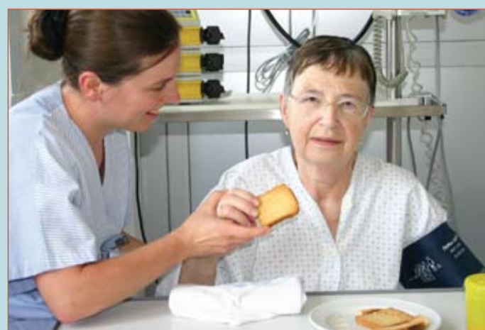
Essen: ein Vorgang – viele Faktoren. Was uns so selbstverständlich erscheint, muss nach dem Schlaganfall oft mit Hilfe verschiedener Spezialisten neu erlernt werden. Üben des Sitzens durch die Physiotherapie, Anbahnung der Arm- und Handfunktion durch die Ergotherapie, Schlucktraining durch die Logopädie und Unterstützung bei der Nahrungsaufnahme durch das diplomierte Pflegepersonal.

Die Betreuung der Patienten erfolgt individuell unter Einbeziehung ihrer Fähigkeiten und Potenziale. So wird zum Beispiel bei der Lagerung eines bettlägerigen Patienten auf seine