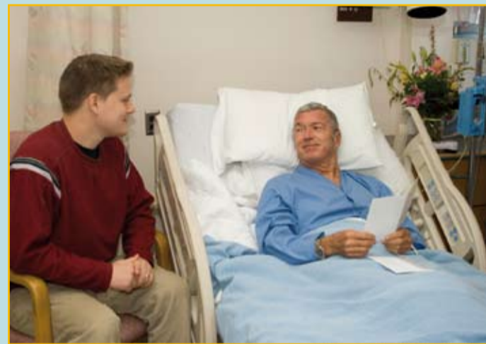
Nicht nur die Überlebenschancen, auch die Chance auf ein weitgehend normales Leben erhöht sich durch eine gute Erstversorgung.

die an einer Stroke Unit behandelt wurden, doppelt so viele zu Hause leben als jene, die eine solche Behandlung nicht erhalten konnten.